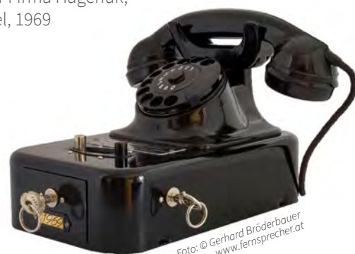
Tisch-Münzfernsprecher der Firma Hagenuk, Kiel, 1969