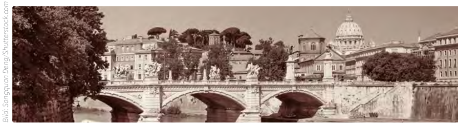
Vatikan mit Petersdom im Hintergrund

der Vatikanischen Bibliothek standen und über eine Zentrale miteinander verbunden waren. Ein Schalter am Telefon stellte automatisch die Verbindung her. Damit entwickelte Marzi Grundprinzipien, die auch bei heute genutzten Systemen noch Anwendung finden. Marzi veräußerte es allerdings, für sein »automatic telephone switchboard« ein Patent anzumelden, sodass beim Thema »Automatische Telefonanlagen« heute andere Erfinder zuerst genannt werden und er nur unter »ferner liefen«. Eine weitere Pioniertat im Auftrag des Heiligen Stuhls: 1938 installierte der geniale Erfinder Guglielmo Marconi die erste auf Mikrowellen basierende Funktelefonverbindung, die den Vatikan mit dem Castel Gandolfo, der Sommerresidenz des Papstes, verband.